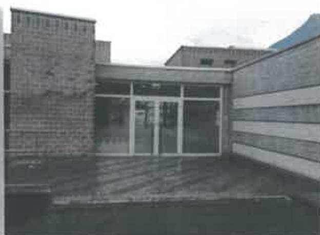
La zona interessata dall'intervento, con la soletta esterna