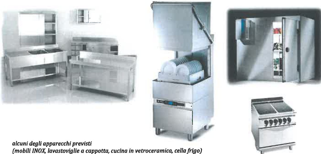
alcuni degli apparecchi previsti (mobili INOX, lavastoviglie a cappotta, cucina in vetroceramica, cella frigo)